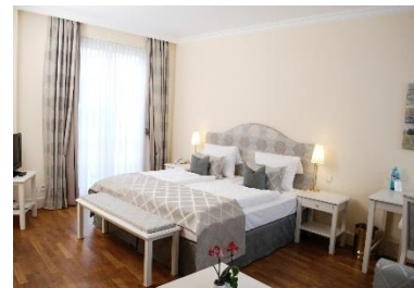
Rheinflügel Doppelzimmer: 130,- EUR Einzelzimmer: 100,- EUR

Bei einer Buchung ab 10 Zimmereinheiten gelten folgende Sonderkonditionen: