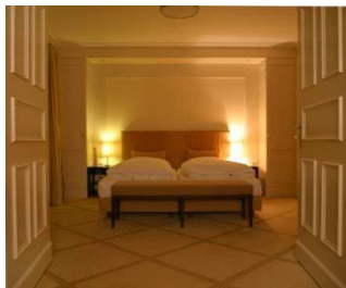
Haupthaus Doppelzimmer: 160,- EUR Einzelzimmer: 105,- EUR

Bei einer Gruppenbuchung von 1-10 Zimmereinheiten bieten wir folgende Tagungs-Sonderkonditionen: